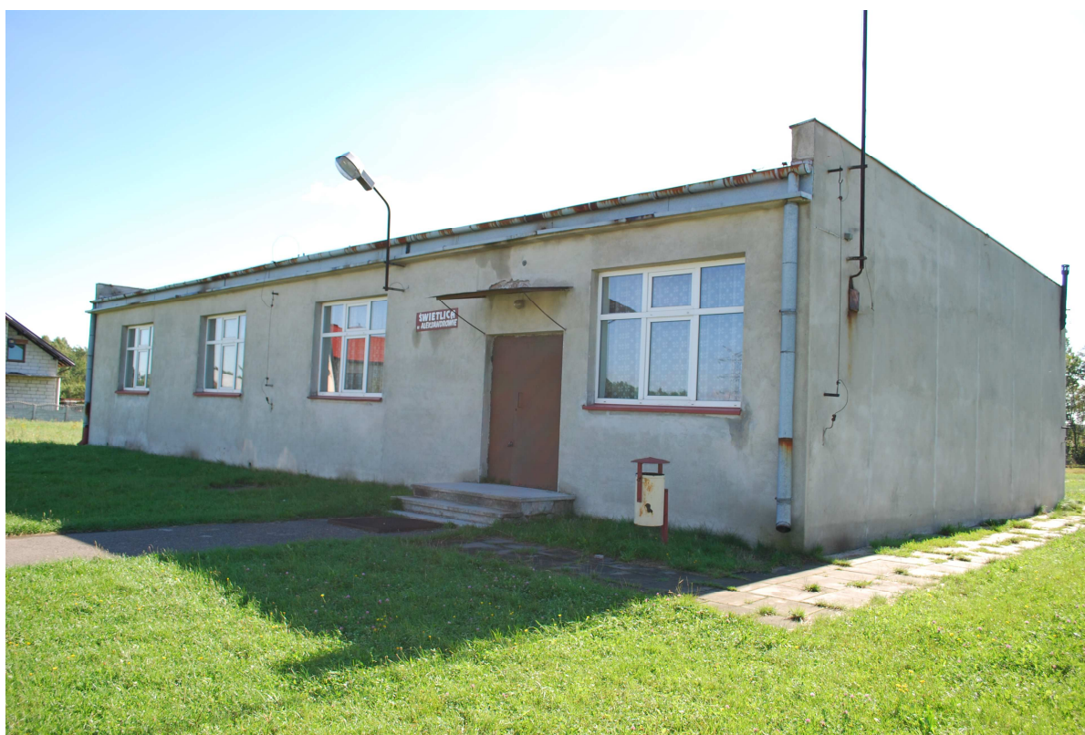
Fot. 3. Budynek świetlicy w Aleksandrowie

W miejscowości znajduje się świetlica wiejska stanowiąca podstawowy element koncentrujący życie zbiorowe Aleksandrowa. Obiekt wymaga poczynienia inwestycji w celu zwiększenia funkcjonalności obiektu oraz poprawy ogólnej estetyki. Przy świetlicy znajduje się niewykorzystany plac należący do Gminy. Plac ten idealnie nadaje się do wykorzystania na cele budowy parkingu.