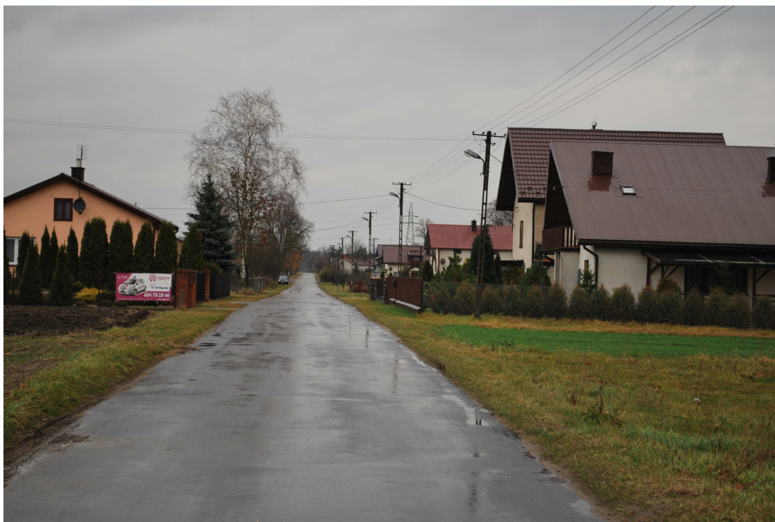
Fot. 1. Zabudowa Aleksandrowa

Mieszkańcy Aleksandrowa mają możliwość korzystania z linii kolejowej tzw. „wiedeńskiej” w relacji: Koluszki – Częstochowa - Katowice z przystankiem Kamięnsk. Linia ta prowadzi głównie ruch pasażerski umożliwiając mieszkańcom wsi łatwy dostęp do siedziby powiatu Radomszczańskiego oddalonego o około 15 km.