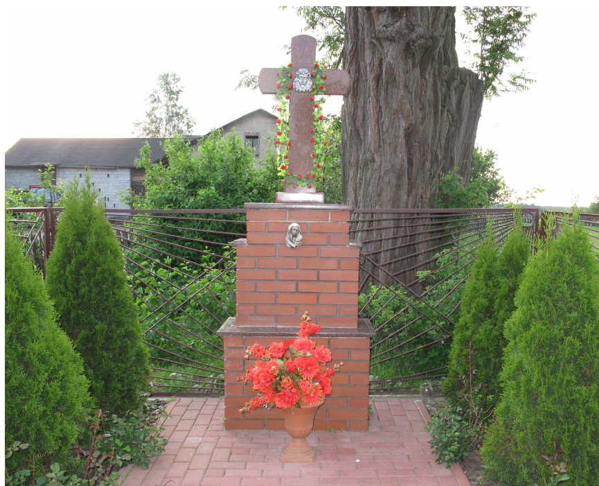
Fot.2 Kapliczka w Aleksandrowie

W Aleksandrowie nie występują żadne obiekty zabytkowe. Pewnymi obiektami wpisującymi się w zakres dziedzictwa kulturowego miejscowości mogą być kapliczki. W Aleksandrowie znajduje się jedna kapliczka zlokalizowana przy drodze gminnej Nr 112152E, w środkowej części wsi.