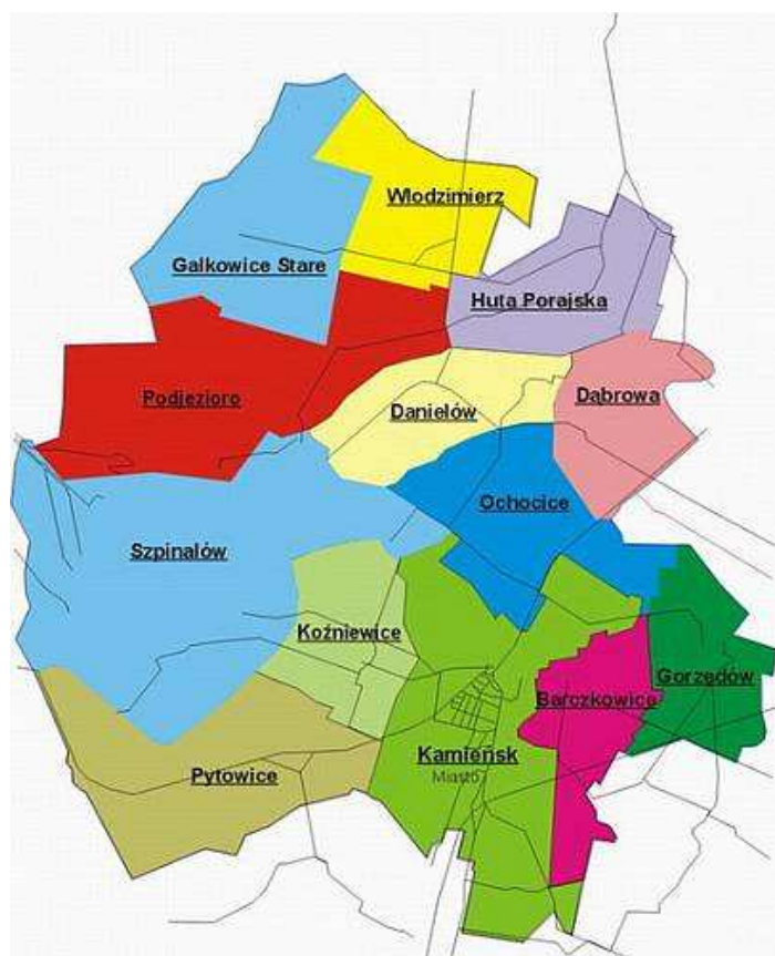
Rys. 1. Gmina Kamięnsk – podział na sołectwa z uwzględnieniem sołectwa Ochoćice obejmującego wieś Aleksandrów.

Miejscowość Aleksandrów położona jest w województwie łódzkim, w powiecie radomszczańskim. Jest jedną z wsi znajdujących się na terenie Gminy Kamięnsk. Usytuowana jest w środkowo – wschodniej części gminy, przy drodze gminnej nr 112152E. Aleksandrów należy do sołectwa Ochoćice. Miejscowość Aleksandrów sąsiaduje z następującymi miejscowościami: Ochoćice, Danielów, Politki.