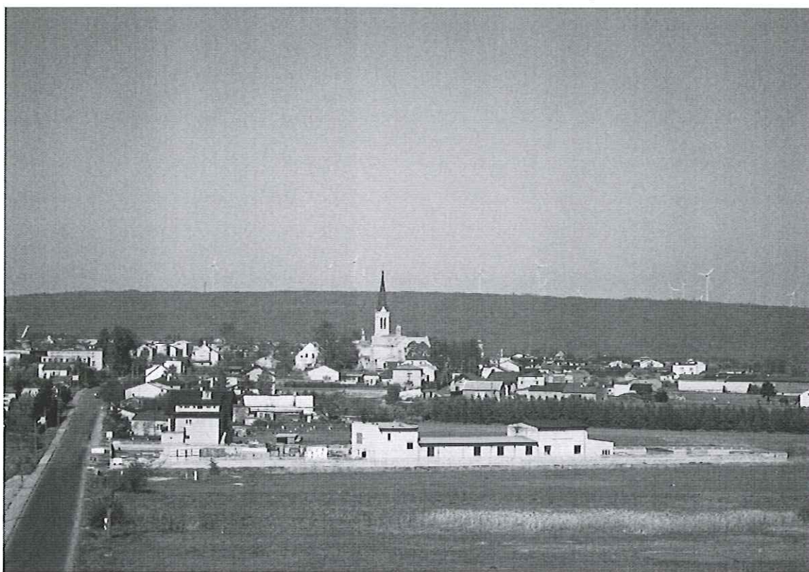
Fot. 1. Panorama Kamińska

Mieszkańcy Kamińska mają możliwość korzystania z linii kolejowej tzw. „wiedeńskiej” w relacji: Warszawa - Katowice z przystankiem Kamińsk. Linia ta prowadzi głównie ruch pasażerski umożliwiając mieszkańcom miasta łatwy dostęp do siedziby powiatu Radomszczańskiego oddalonego o około 15 km.