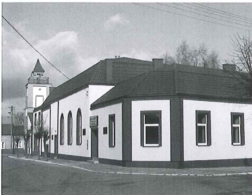
Fot. 4. Dom Ludowy im. Kazimierza Tazbira w Kamięnsku