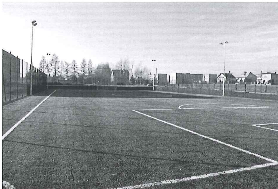
Fot.5. Boisko sportowe „ORLIK” w Kamieńsku

Na terenie Zespołu Szkolno – Przedszkolnego w Kamieńsku powstał w 2012 r. plac zabaw.