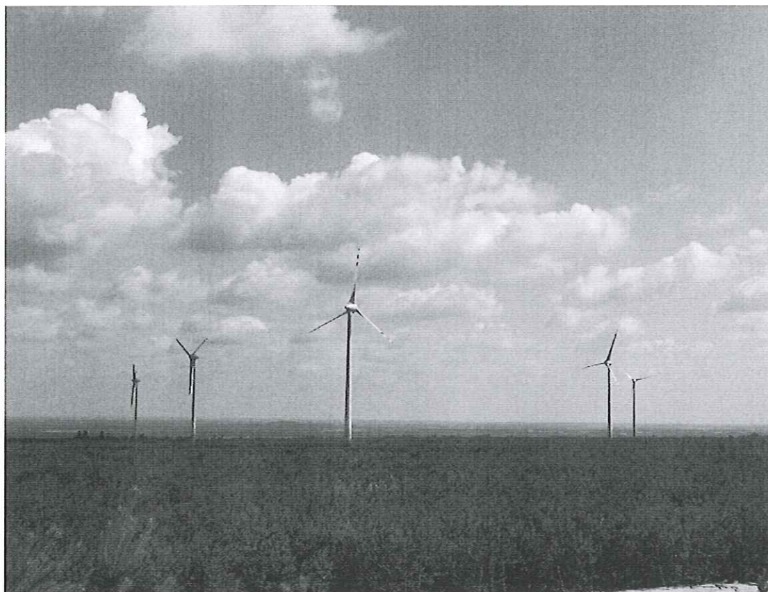
Fot. 7. Park elektrowni wiatrowych na Górze Kamieńsk