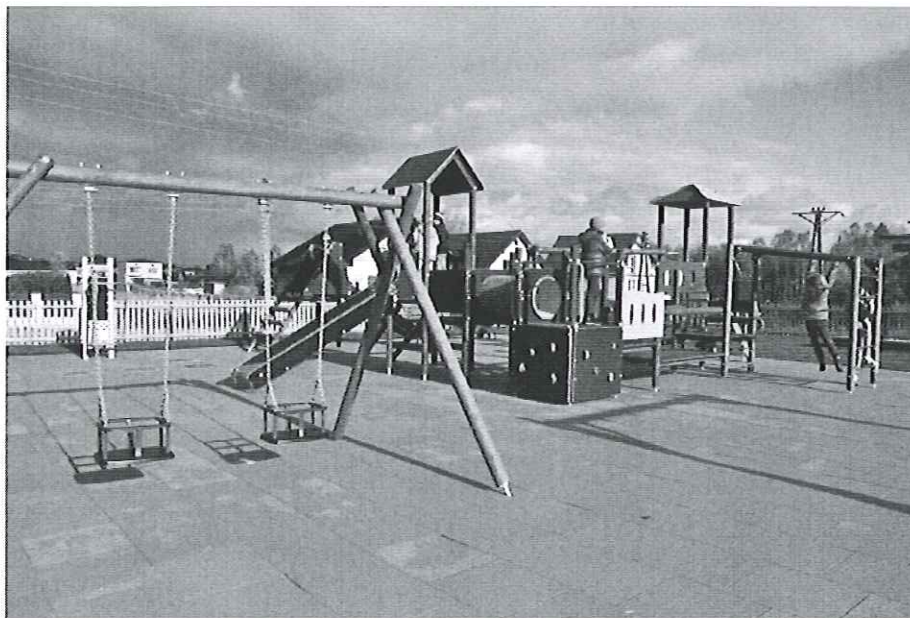
Fot. 6. Plac zabaw w Kamieńsku

Na terenie Zespołu Szkolno – Przedszkolnego w Kamieńsku powstał w 2012 r. plac zabaw.