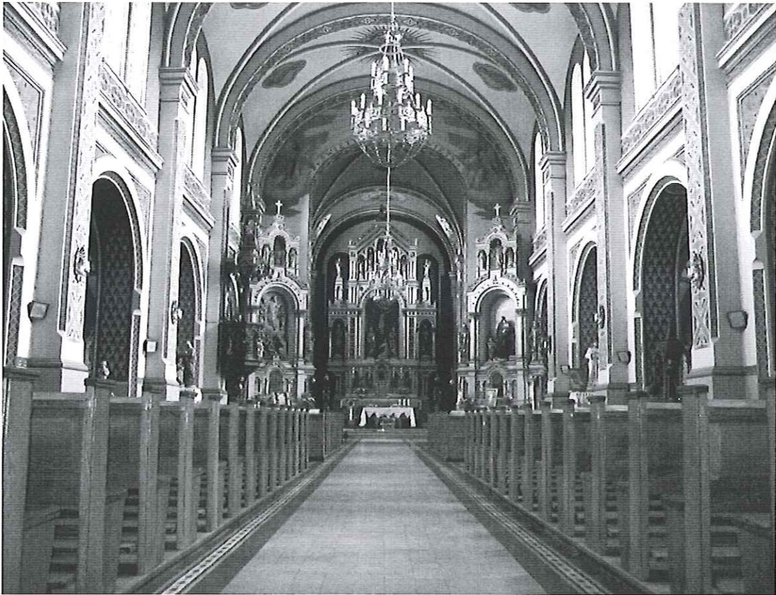
Fot. 3 Wnętrze kościoła rzymsko – katolickiego z początku XVI- XX w.