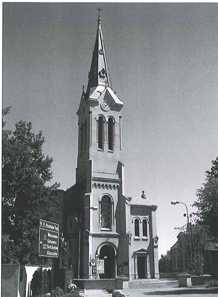
Fot. 2 Kościół rzymsko – katolicki z początku XVI- XX w. w Kamieńsku

W Kamieńsku znajduje się obiekt zabytkowy wpisany do rejestru zabytków oraz wojewódzkiej i gminnej ewidencji zabytków. Jest to kościół parafii rzymsko-katolickiej p.w. św. Piotra i Pawła. Wikariatka i brama kościoła parafii rzymsko-katolickiej, dworzec kolejowy oraz cmentarz rzymsko-katolicki są obiektami wpisanymi do wojewódzkiej i gminnej ewidencji zabytków. Plebania kościoła parafii rzymsko-katolickiej, domy murowane: ul. T. Kościuszki 16, ul. Zjednoczenia, ul. M. Konopnickiej 10 są ujęte natomiast gminnej ewidencji zabytków.