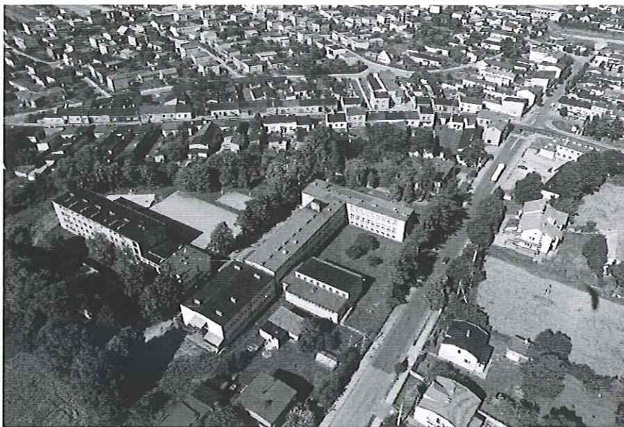
Rys. 6. Zdjęcie lotnicze miasta Kamięńska – układ dróg