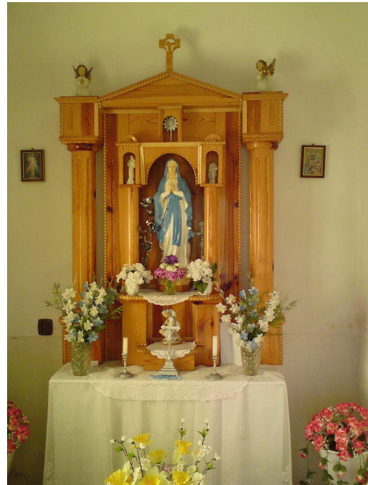
Fot. 3 i 4 Kapliczka rzymsko – katolicka z początku XVIII wieku.