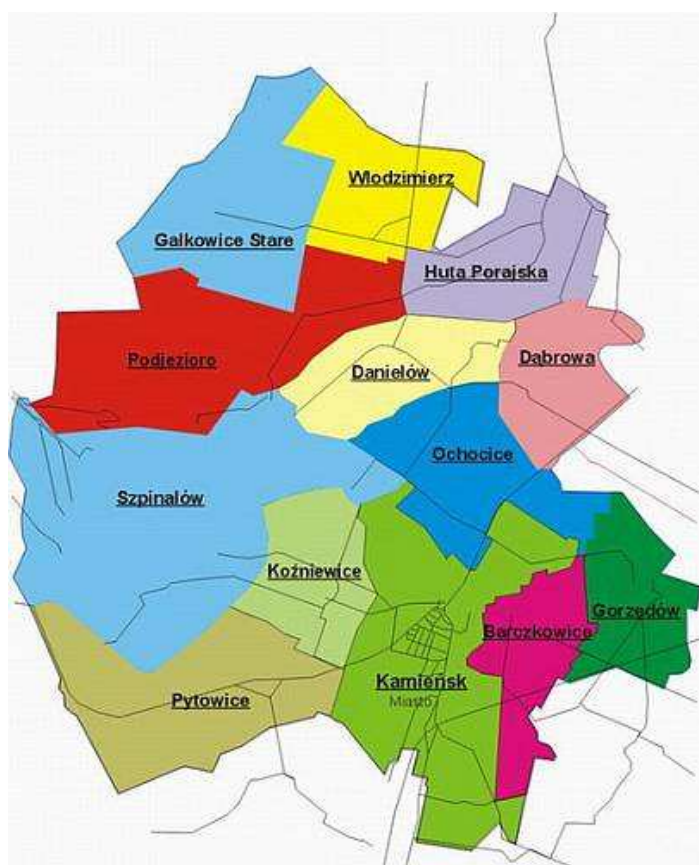
Rys. 1. Gmina Kamięnsk – podział na sołectwa z uwzględnieniem sołectwa Ochocice

Miejscowość Ochocice położona jest w województwie łódzkim, w powiecie radomszczańskim. Jest jedną z wsi znajdujących się na terenie Gminy Kamięnsk. Usytuowana jest w środkowo – wschodniej części gminy, przy drodze gminnej nr 3915E. Sołectwo Ochocice obejmuje dwie wsie: Ochocice oraz Aleksandrów. Ochocice sąsiadują z następującymi miejscowościami: Kamięnsk, Aleksandrów, Dąbrowa.