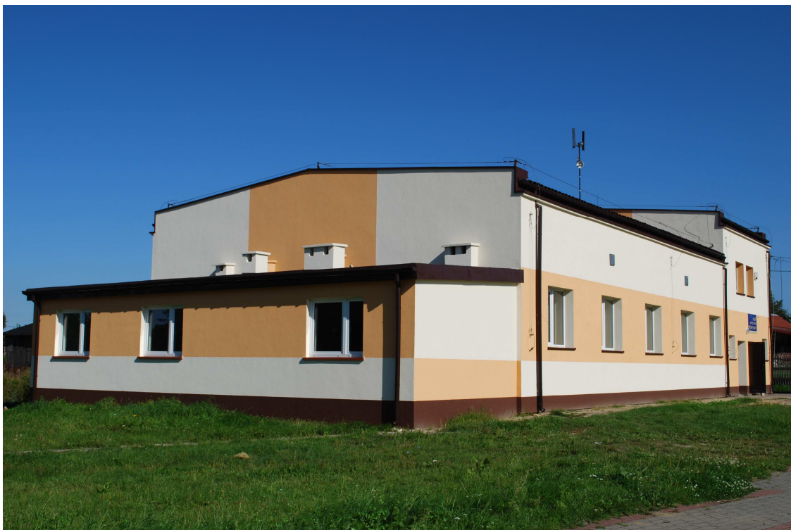
Fot. 5. Budynek świetlicy w Ochocicach