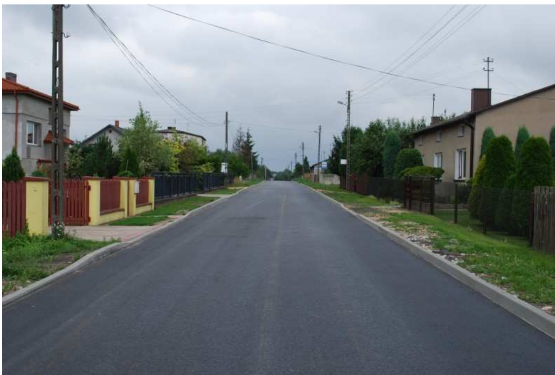
Fot. 1. Zabudowa Ochocic

Mieszkańcy Ochocic mają możliwość korzystania z linii kolejowej tzw. „wiedeńskiej” w relacji: Koluszki – Częstochowa - Katowice z przystankiem Kamieńsk. Linia ta prowadzi głównie ruch pasażerski umożliwiając mieszkańcom wsi łatwy dostęp do siedziby powiatu Radomszczańskiego oddalonego o około 15 km.