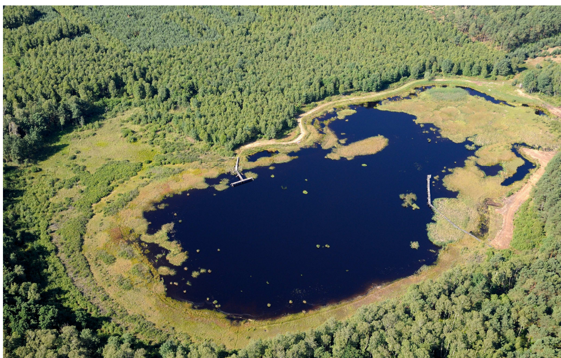
Fot. 2. Zbiornik wodny „Jeziorko Ochockie”

W krajobrazie sołectwa Ochocice występują pola uprawne, lasy, użytki zielone w postaci łąk i pastwisk.